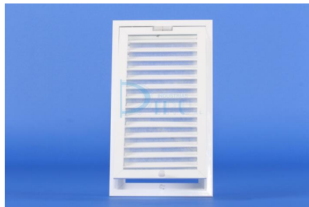
Mod. RRFV-MF (abierta)